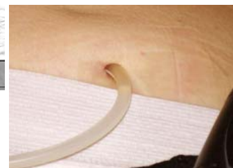
Austrittsstelle („Exit“) des CAPD-Katheters